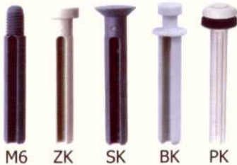
M6 ZK SK BK PK

8 x 80 mm (SK) 8 x 100 mm (SK) 8 x 120 mm (SK) 10 x 110 mm (ZK)